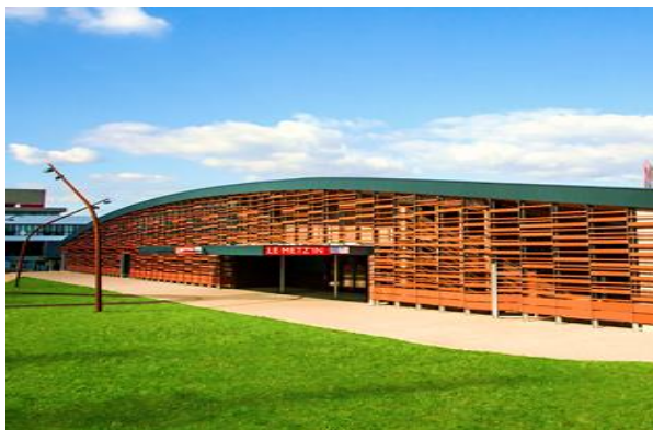
A 100 m de l'UFR MIM - 6 rue Augustin Fresnel